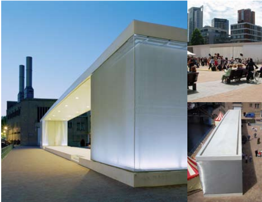
Urban Activators: theater podium & brug Grotekerkplein Rotterdam [Holanda], 2009

AUTORES: Atelier Kempe Thill architects and planners