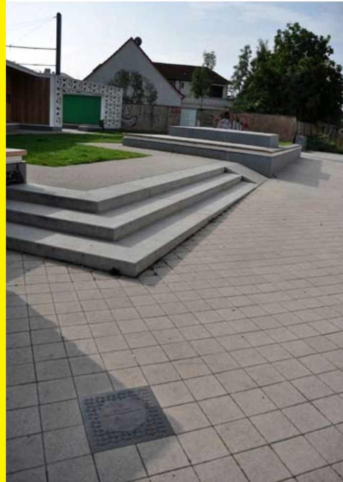
La placa del Premio está colocada ante la Open-Air-Library en Magdeburgo.