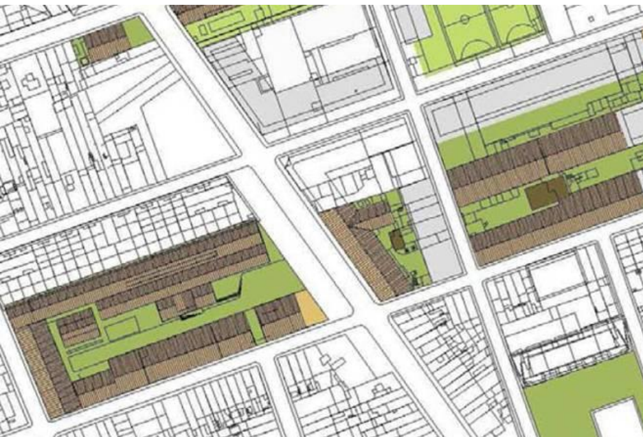
font: pla especial d'intervenció en el paisatge urbà (2006), ajuntament de Sabadell