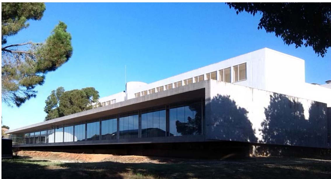
Campus Sant Cugat del Vallès, Edifici SC3 Carrer Pere Serra 1-15. 08173 Sant Cugat del Vallès